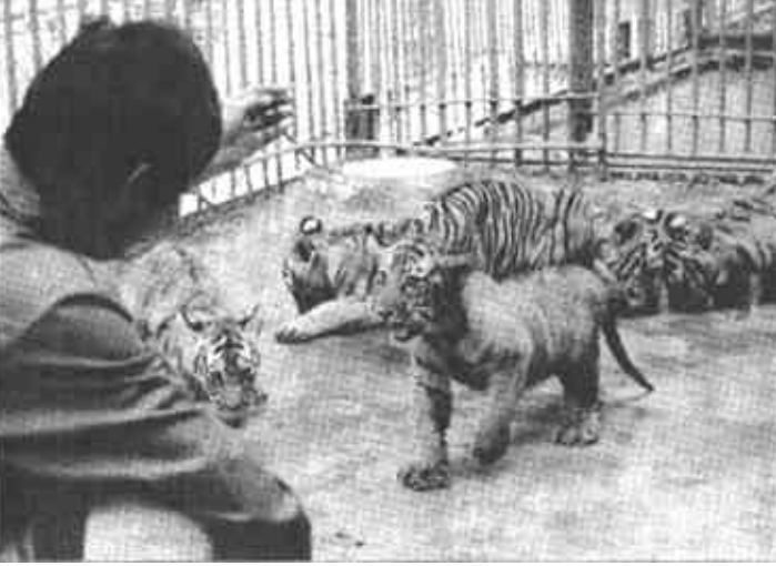
7月15日,河南省商丘市动物园工作人员为小东北虎仔喂食。2003年4月,河南省商丘市动物园一只母东北虎一胎生育5只虎仔...