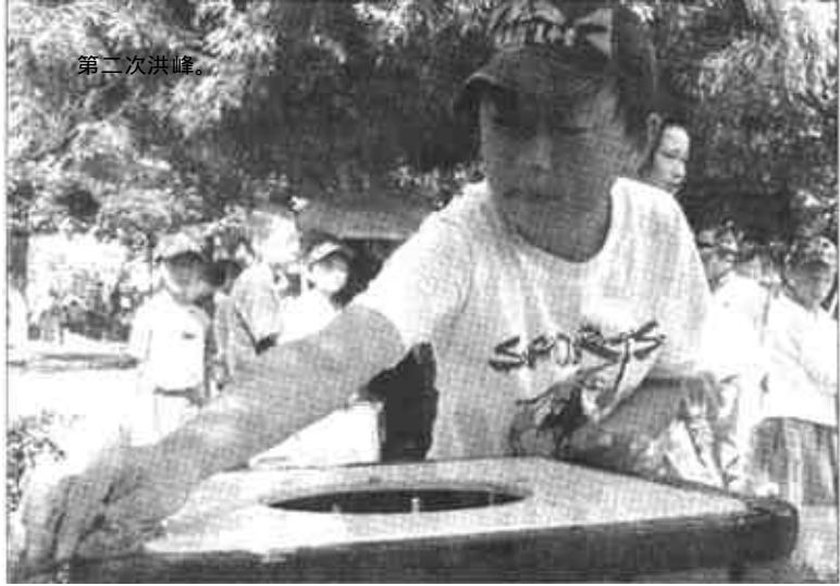
7月15日,参加庐山风景名胜第一小学“我能行”夏令营的400名学生在牯岭正街清洁公用设施...