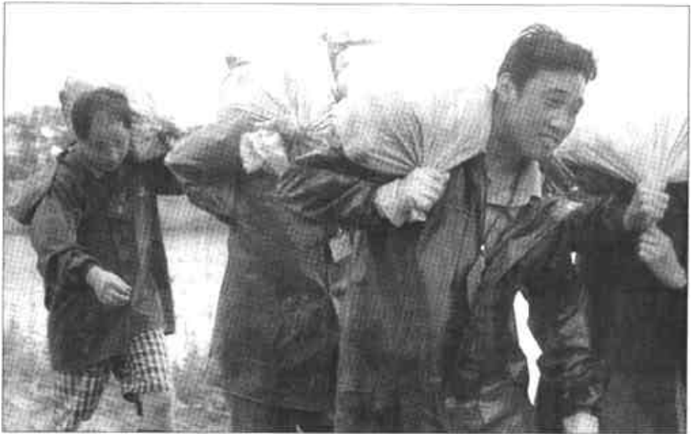
7月15日,江苏洪泽县干部群众在抢运土袋。随着淮河第二次洪峰向洪泽湖推进,洪泽湖水位持续上涨...