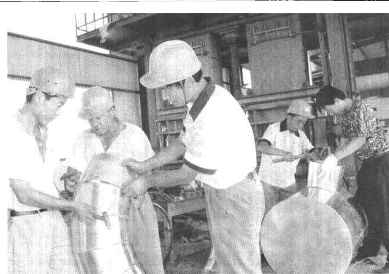
广饶县陈官乡通过招商引资引进的信源棉业有限责任公司，是集棉花加工、精品油加工、饲料加工于一体的棉花产品综合性加工企业。目前，该公司土建工程到位资金2000万元，图为技术人员正在进行设备安装。

该区聘请了40名各学科专家、教授为政府顾问、企业技术顾问。全区有11家企业从大院大所选聘了技术顾问、技术厂长、星期日工程师等。区政府聘任中科院彭少逸院士为高级顾问，聘任青岛海洋大学王克行、王汝才两位教授为政府科技经济顾问。该区还邀请了100余名专家学者围绕提高科技意识、农村适用技术推广应用等各个方面举办了各种类型的报告会、培训班。为加快人才、成果的引进步伐。该区坚持“不求所有、但求所用”的原则，在北京、西安、大连、沈阳4座城市设立了科技招商站，聘请高等院校的专家教授为招商站负责人，充分调动专家教授的积极性和主动性，宣传河口区的优惠政策，帮助筛选、引进科技含量高、市场前景好的项目，让外智为河口区的经济建设服务。该区还结合区域特点，积极加强油地军科技合作，按照“人才联用、项目联建、利益共享”的原则，积极与油田、济军生产基地进行人才、项目、技术交流，盘活区域科技资源。广泛吸纳油田、济军基地的科技人才，建立起了人才库；积极从油田聘请科技人才担任企业技术顾问。大量人才的引进，优化了河口区的人才结构，为该区的发展注入了强大的活力。(王振东)