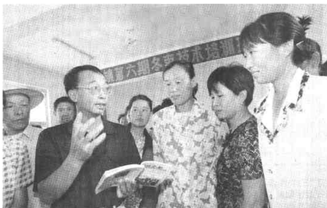
7月12日,东营区史口镇在温家村举办了第六期冬枣栽培技术培训,刚刚成立不久的史口镇冬枣协会为枣农们请来省林果研究所和市林业局的果树专家授课,深受枣农欢迎。